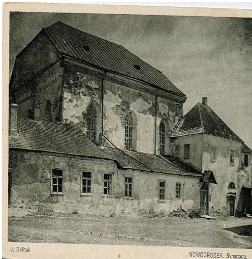
Sinagoga de Nowogrudez

En junio de 1941, los alemanes invadieron Rusia, momento en el cual comienza la persecución, masacre y aislamiento en guetos a los judíos. Llegaron a la localidad de Novogrudez donde existía una comunidad judía importante. El tamaño de la comunidad lo demostraba y especialmente, el gran número de sinagogas, la diversidad de opiniones políticas y organizaciones (comunistas, socialistas, bundistas, nacionalistas, así como grupos sionistas). La ciudad tenía periódicos que se publicaban en yiddish, y una sólida biblioteca. Además, contaba con grupos de teatro, música, coros, etc. También hubo asociaciones deportivas como Maccabi, incluyendo un equipo de fútbol que jugaba en la liga local y un equipo de ciclismo.